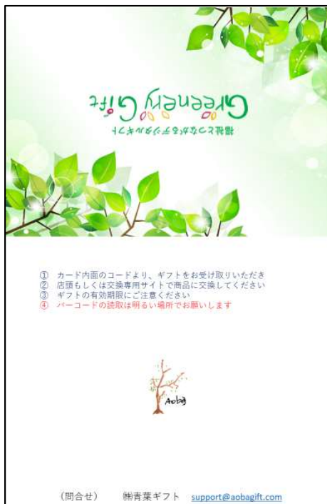
(メッセージカード表裏イメージ)