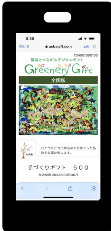
(ギフト画面イメージ)