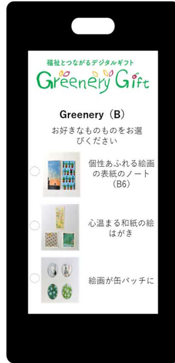
(交換サイトイメージ)